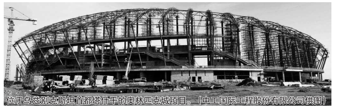
位于乌兹别克斯坦首都塔什干的奥林匹克城项目。

国间落地的首个大型合作项目,也是中资企业在乌第一个全面采用中国标准设计、建设、验收的项目。