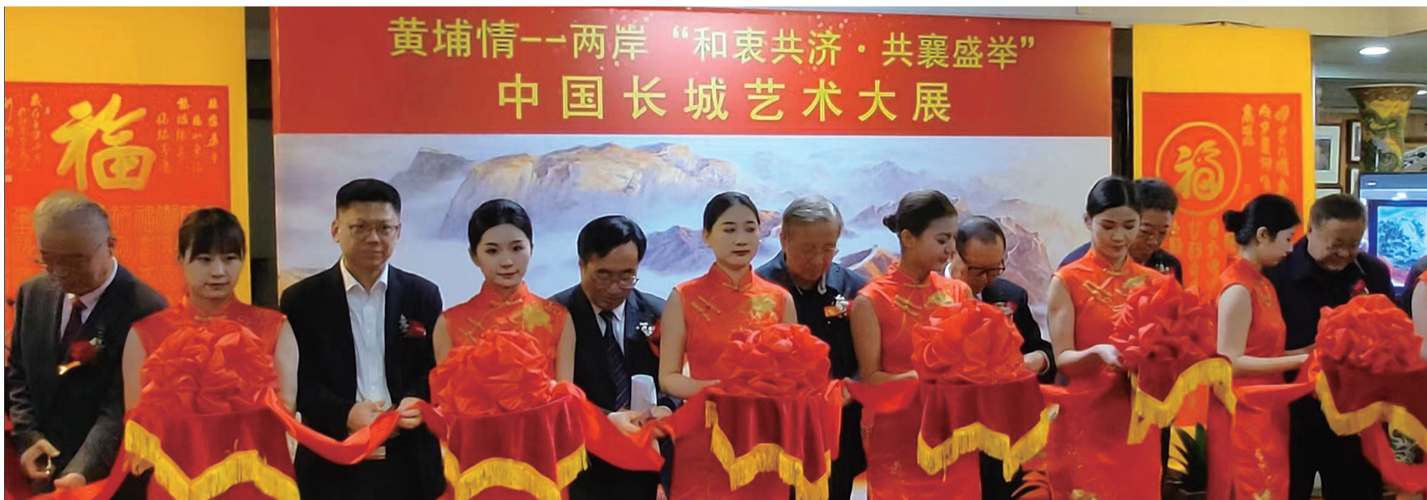
出席黄埔情——两岸“和衷共济·共襄盛举”中国长城艺术大展的领导参加剪彩仪式

习近平总书记在二十大报告中指出,“我们始终尊重、关爱、造福台湾同胞,继续致力于促进两岸经济文化交流合作,推动两岸共同弘扬中华文化,促进两岸同胞心灵契合。”这既体现了对广大台湾同胞一如既往的殷殷关切,也强调了继往开来弘扬中华文化的重要意义,为我们推进两岸交流指明了方向。新时代新征程,我们将和台湾同胞一道,以弘扬中华文化为纽带,不断推动两岸文化艺术交流合作,促进两岸关系和平发展、融合发展,为实现祖国完全统一和中华民族伟大复兴而不懈奋斗。本次画展将向公众展出5个月。期间,还将举办“长城文化论坛”和“两岸文化交流论坛”,将两岸文化交流推向新的高潮。