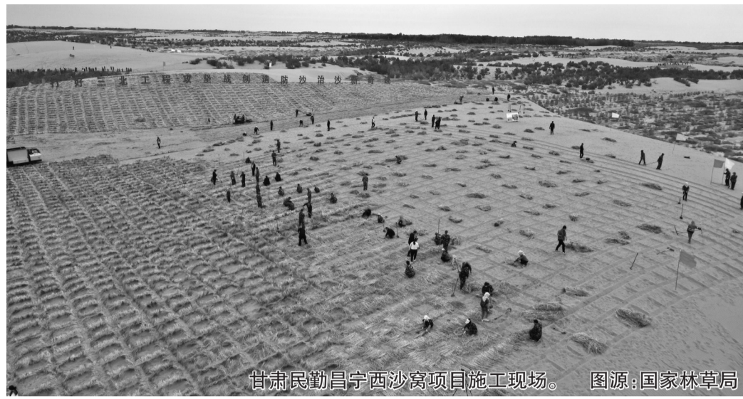
甘肃民勤昌宁西沙窝项目施工现场。

划图”不断清晰。围绕“打什么”“在哪打”“怎么打”等关键问题,中办、国办印发《关于加强荒漠化综合防治和推进“三北”等重点生态工程建设的意见》。国务院建立“三北”工程协调机制并制定印发“1+N+X”工作方案,明确相关部门重点任务和分工。国家林草局会同国家发展改革委等部门修编“三北”工程总体规划,谋划布局68个重点项目,其中三大标志性战役区域涉及328个县、布局35个重点项目。