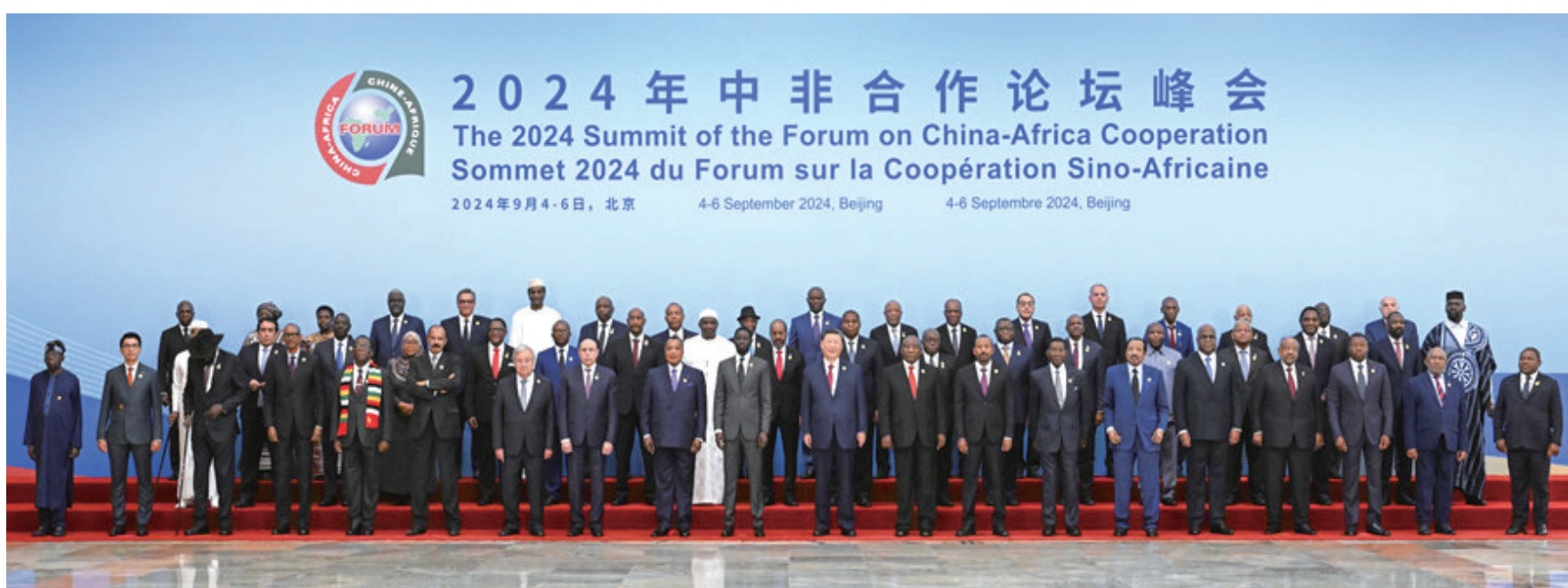
9月5日上午，国家主席习近平在北京人民大会堂出席中非合作论坛北京峰会开幕式并发表主旨讲话。这是开幕式前，习近平同出席峰会的外方领导人集体合影。

新华社北京9月5日电 9月5日上午，国家主席习近平在北京人民大会堂出席中非合作论坛北京峰会开幕式并发表主旨讲话。习近平宣布，中国同所有非洲建交国的双边关系提升到战略关系层面，中非关系整体定位提升到新时代全天候中非命运共同体，将实施中非携手推进现代化十大伙伴行动。