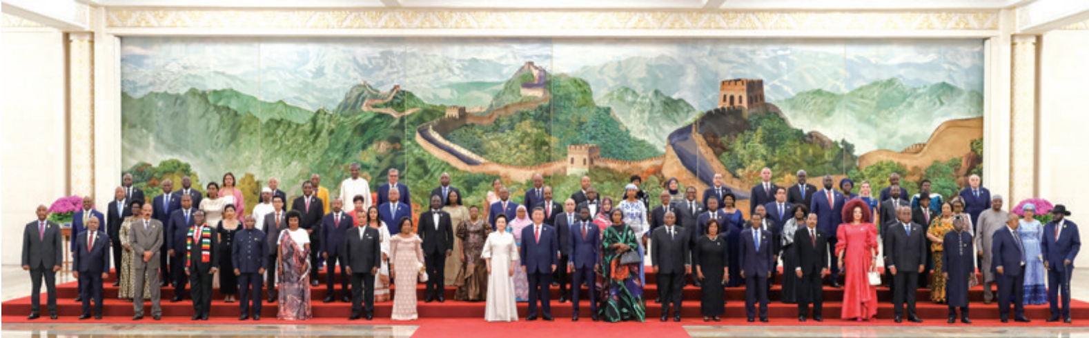
9月4日晚，国家主席习近平和夫人彭丽媛在北京人民大会堂举行宴会，欢迎来华出席中非合作论坛北京峰会的非方及国际贵宾。这是宴会前，习近平和彭丽媛同贵宾们集体合影留念。

新华社北京9月4日电 9月4日晚，国家主席习近平和夫人彭丽媛在北京人民大会堂举行宴会，欢迎来华出席中非合作论坛北京峰会的非方及国际贵宾。