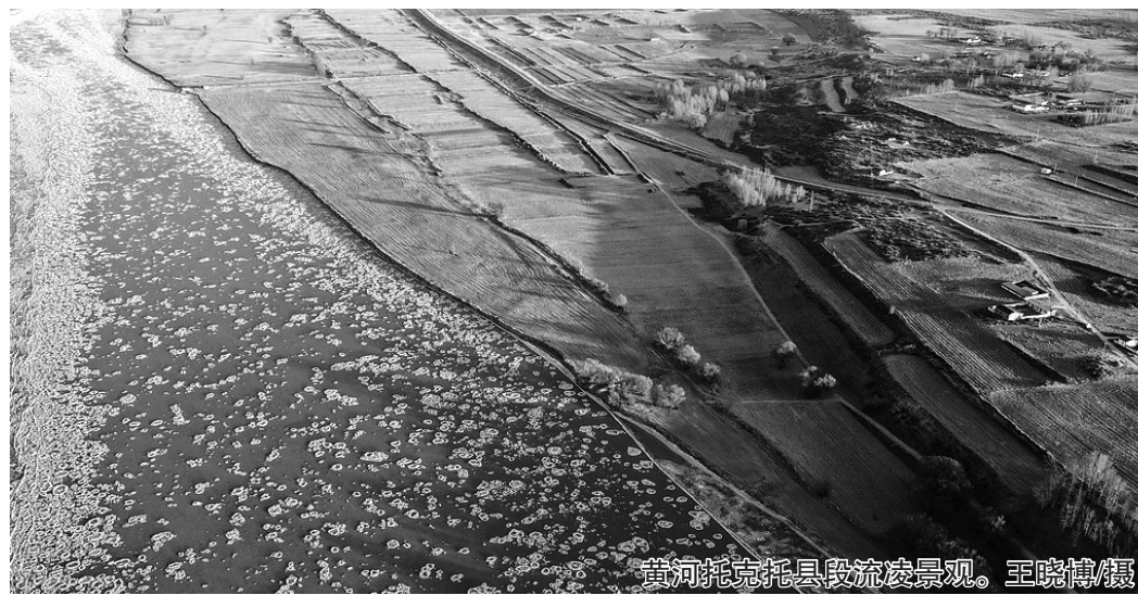
黄河托克托县段流凌景观。

2024年,托克托县依托紧邻黄河的优势,组织开展沿黄奔跑会、黄河开河节、黄河文化旅游节等系列文化旅游体育活动。去年全县接待旅游人数88.21万人次,旅游收入达到9696.92万元。