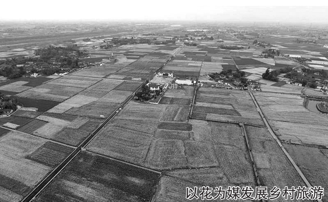
以花为媒发展乡村旅游

键材料;通用航空产业发展迅猛,作为新兴产业蕴含巨大潜力;数字经济蓬勃兴起,为工业发展注入新活力,吸引相关数字技术、智能制造等企业投资入驻。